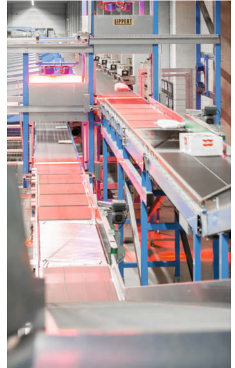
Identifikation und optionale Volumen- und Gewichtserfassung

Sortierbereich genügen bereits wenige Sensorik-Elemente. Zudem sind alle Aggregate gut zugänglich. Das sorgt insgesamt für hohe Verfügbarkeit bei geringen Wartungskosten.