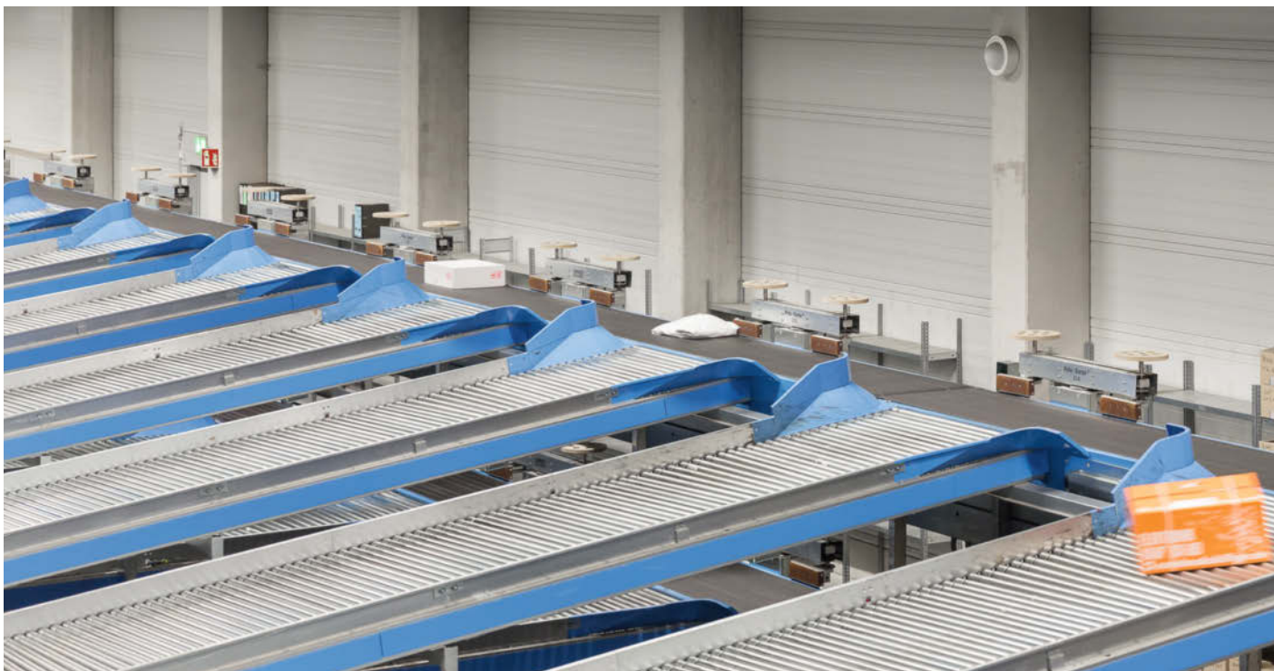
Sortierung unterschiedlichster Artikel auf einem Sorter – ab Tüten, Polybags oder Pakete

Mit der Produktportfolio-Ergänzung von BEUMER setzen Sie auf ein Multitalent mit hoher Leistungsfähigkeit: Der Rota-Sorter® bewältigt auf einer einzelnen Linie ein breites Artikelspektrum in Höchstgeschwindigkeit – und das dank einzigartiger Ausschleusstechnik äußerst schonend. Auch in Sachen Flexibilität und Wirtschaftlichkeit zeichnet sich die Anlage durch Spitzenwerte aus.